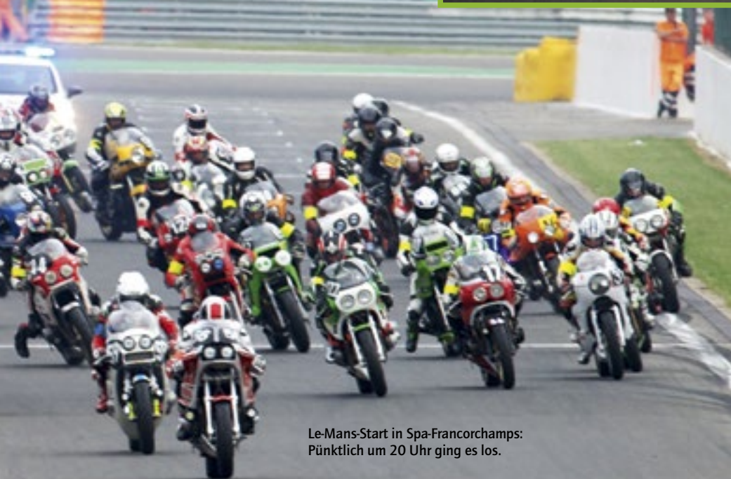
Le-Mans-Start in Spa-Francorchamps: Pünktlich um 20 Uhr ging es los.

vor genau 40 Jahren den Grand Prix von Belgien in der 50-cm 3 -Klasse gewann, war auszumachen. Aber nicht nur grosse Fahrernamen, auch eine Vielzahl hochinteressanter Maschinen, die im Fahrerlager und auf der Strecke zu sehen waren, lohnten einen Ausflug an die Bikers' Classics. Von Kreidler bis Casal, von Benelli bis Itom, von Suzuki bis Honda: All diese Marken waren zu sehen – und zu hören.