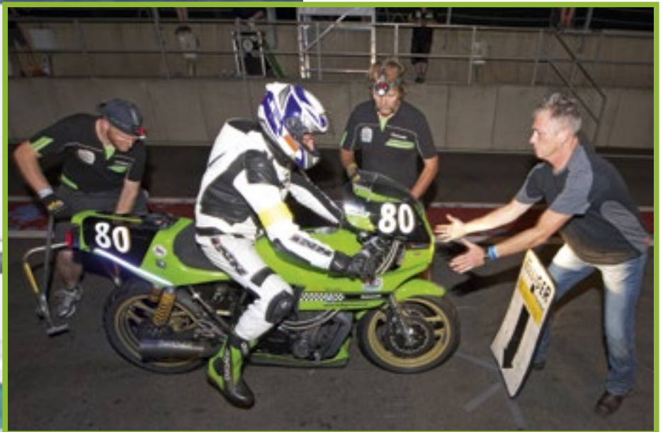
Boxenstopp beim Team Bolliger Switzerland: Nach Rennhälfte mussten die Bremsbeläge getauscht werden.