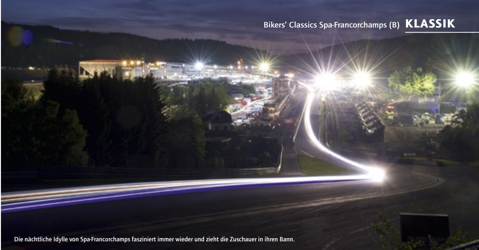
Die nächtliche Idylle von Spa-Francorchamps fasziniert immer wieder und zieht die Zuschauer in ihren Bann.